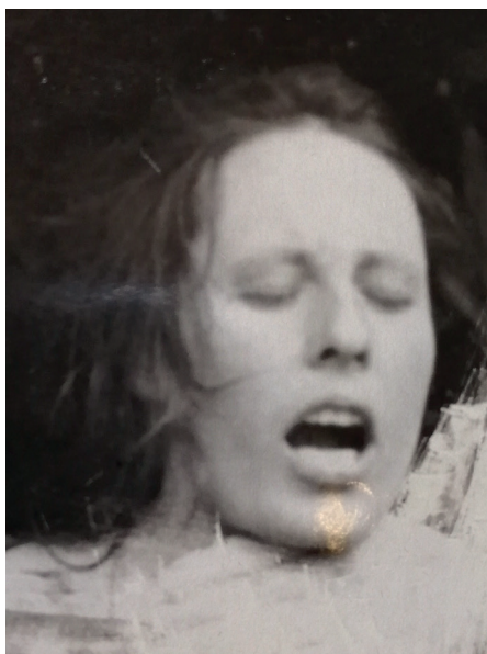
Фото 2 и 3.